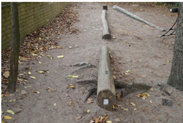
Redskab: Balancebom Årgang: Producent: Lekolar Er redskabet mærket: Ja Emne 7: Er der registreret fejl / mangler: Ja