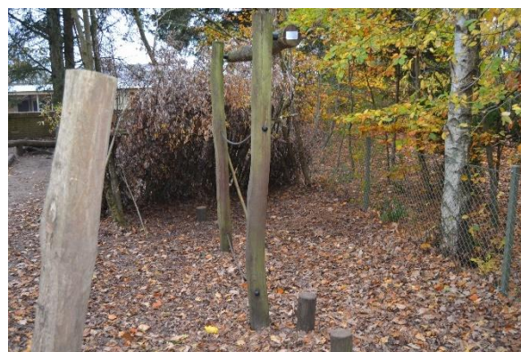
Redskab: Balancebom Producent: Rudeco a/s Er redskabet mærket: Ja Emne 4: Er der registreret fejl / mangler: Nej