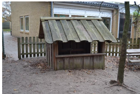
Redskab: Legehus Årgang: 2010 Producent: Rudeco a/s Er redskabet mærket: Ja Emne 8: Er der registreret fejl / mangler: Ja