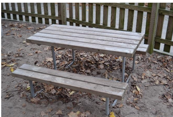
Redskab: Bord bæk sæt Ikke omfattet af DS/EN 1176 Emne 9: