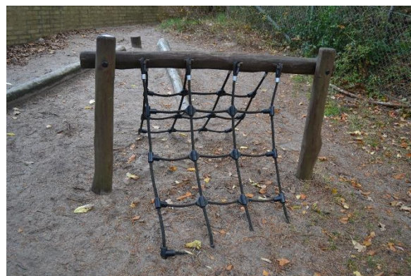
Redskab: Balancenet Producent: Rudeco a/s Er redskabet mærket: Ja Emne 6: Er der registreret fejl / mangler: Nej