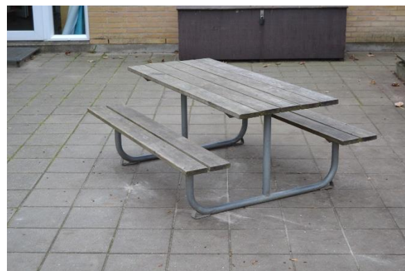
Redskab: Bord bænk sæt