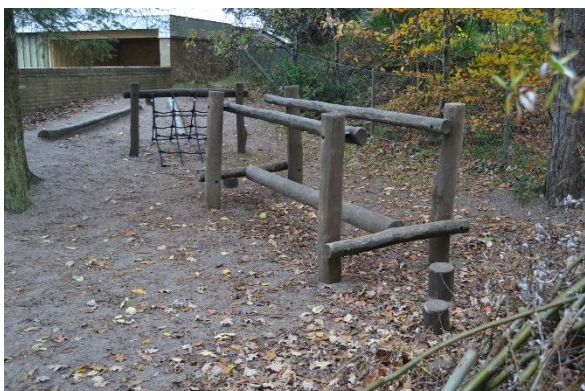
Redskab: Balancebom Producent: Rudeco a/s Er redskabet mærket: Ja Emne 5: Er der registreret fejl / mangler: Nej