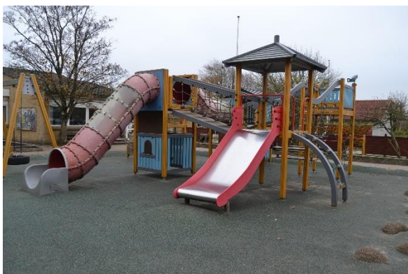
Redskab: Legetårn m. rutsjebane Årgang:

Emne 14: Er der registreret fejl / mangler: Ja