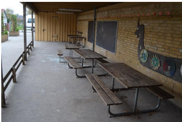
Redskab: Madpakke hus