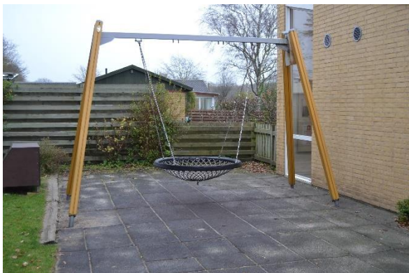
Redskab: Gyng Producent: Lappest Er redskabet mærket: Ja Emne 1: Er der registreret fejl / mangler: Ja