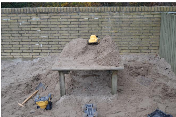
Redskab: Legebord Ikke omfattet af DS/EN 1176 Emne 11: