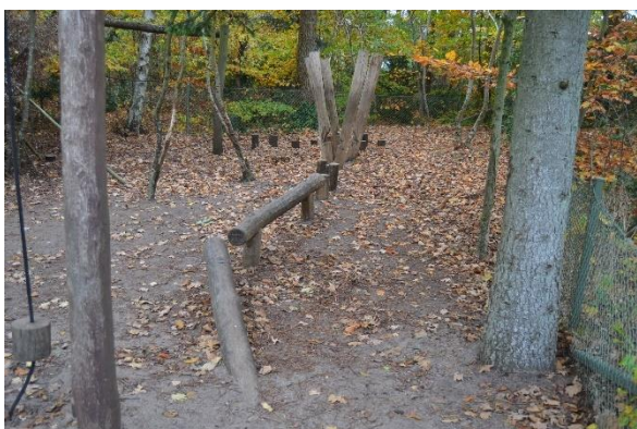
Redskab: Balancebom Producent: Rudeco a/s Er redskabet mærket: Ja Emne 3: Er der registreret fejl / mangler: Ja