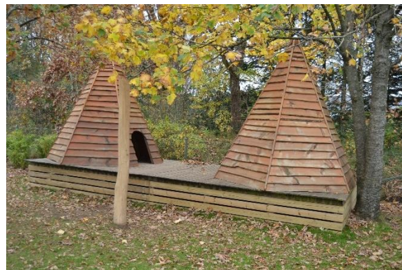
Redskab: Legehus Producent: Rejstrup savværd Er redskabet mærket: Ja Emne 2: Er der registreret fejl / mangler: Nej