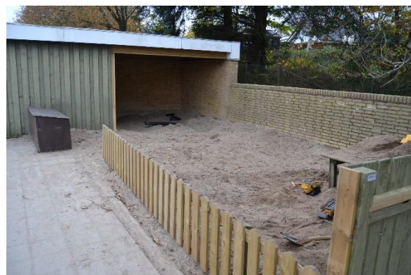
Redskab: Sandkasse Årgang: 2008 Producent: Er redskabet mærket: Ja Emne 12: Er der registreret fejl / mangler: Nej