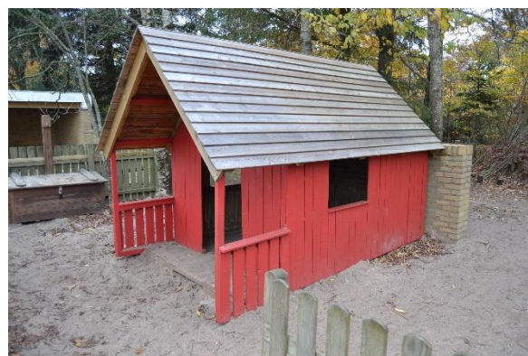
Redskab: Legehus Årgang: 2012 Producent: Egen produktion Er redskabet mærket: Ja Emne 10: Er der registreret fejl / mangler: Nej